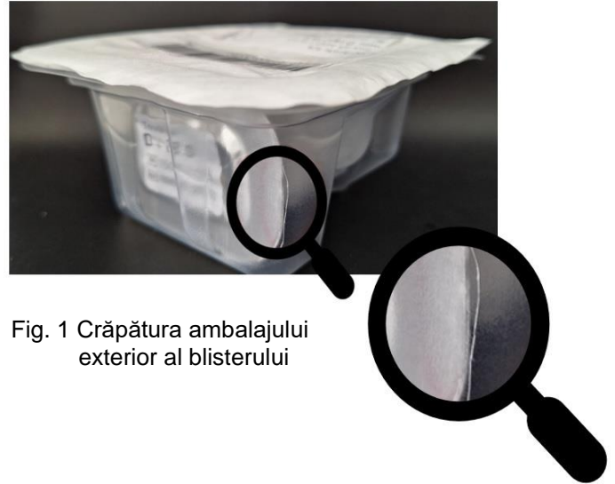
Fig. 1 Crăpătura ambalajului exterior al blisterului

Ambalajul primar, recipientul de autodescărcare (Safeloader), care conține lentila intraoculară depozitată în soluție salină, nu prezintă niciun semn de deteriorare. Calitatea implantului este în continuare garantată în orice moment. Cu toate acestea, ca măsură de precauție, vă rugăm să nu utilizați produsele cu ambalajul exterior al blisterului deteriorat.